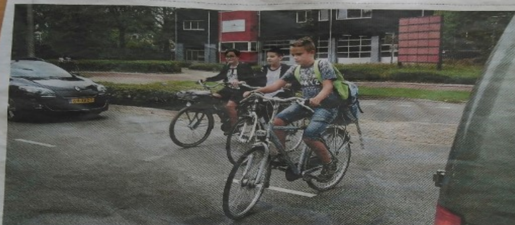
Arnhemse brugklassers hebben zojuist hun boeken opgehaald en steken voor hun school de weg over.